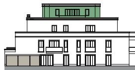
Ansicht von Nordwesten (o.M.)