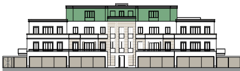
Ansicht von Nordosten (o.M.)