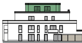
Ansicht von Südosten (o.M.)