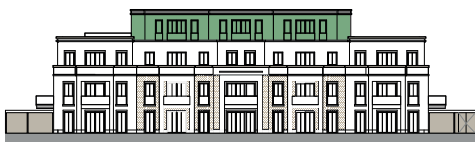
Ansicht von Südwesten (o.M.)