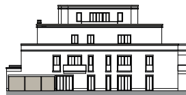
Ansicht von Nordwesten (o.M.)