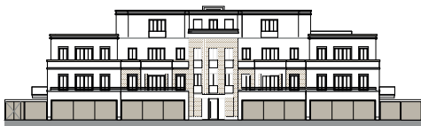
Ansicht von Nordosten (o.M.)

* Möblierung / Küche sind nicht im Kaufpreis enthalten. * Druckfehler, Irrtümer und Änderungen vorbehalten.