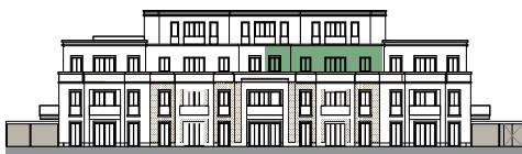
Ansicht von Südwesten (o.M.)