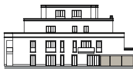
Ansicht von Südosten (o.M.)