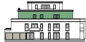
Ansicht von Nordwesten (o.M.)