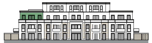
Ansicht von Südwesten (o.M.)