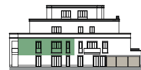
Ansicht von Südosten (o.M.)