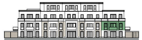
Ansicht von Südwesten (o.M.)