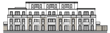
Ansicht von Südwesten (o.M.)