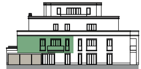
Ansicht von Nordwesten (o.M.)