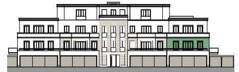
Ansicht von Nordosten (o.M.)