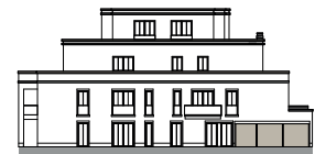
Ansicht von Südosten (o.M.)