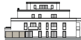
Ansicht von Nordwesten (o.M.)