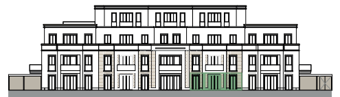
Ansicht von Südwesten (o.M.)